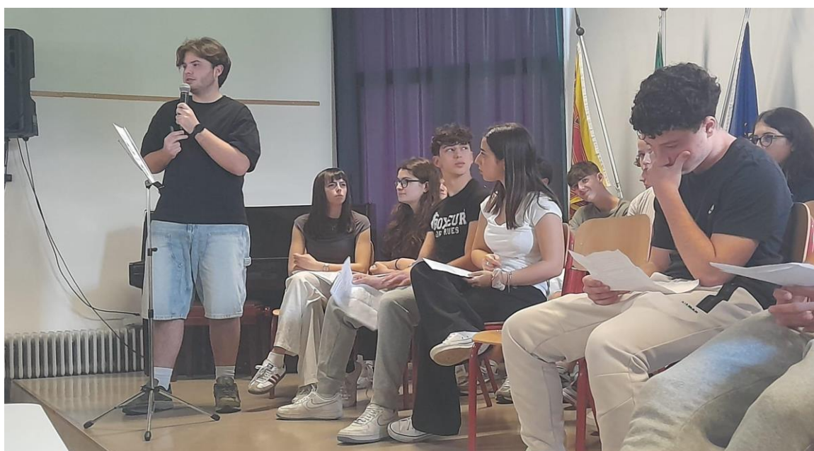
Esposizione studenti, avvenuta martedì 4 giugno presso l'aula magna del Liceo Berto

Lanciato nel pentamestre dell'anno scolastico 2023-2024, il progetto ha coinvolto direttamente gli studenti nel processo di raccolta e analisi dei dati demografici. La fase iniziale ha visto la somministrazione di un questionario online intitolato "Caratteristiche della popolazione e presenza giovanile: una fotografia di oggi, di ieri e di domani", compilato da 962 studenti su 1103 iscritti, raggiungendo un impressionante tasso di risposta dell'87%.